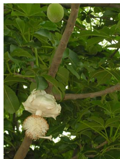
Fleur de baobab (Adansonia digitata) au Sénégal ⇒